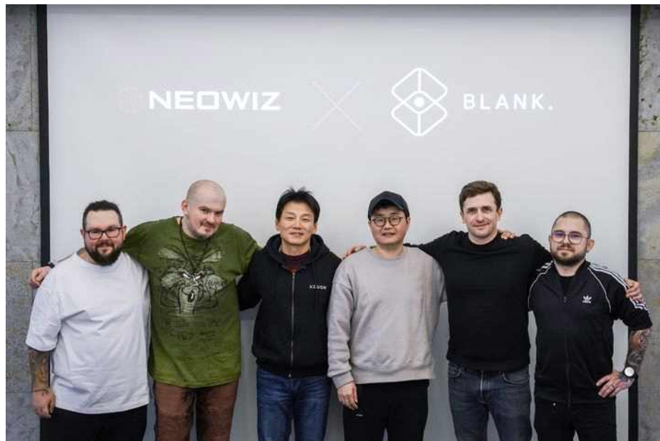
그림2 | 네오위즈는 2023년 11월, 폴란드 스튜디오 '블랭크'에 전략적 투자를 단행했다.