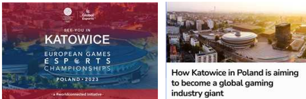
그림3 | 유럽 e스포츠의 수도로 성장한 폴란드의 도시 카토비체