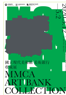
국립현대미술관 미술은행 소장품전 (사건진출처:주홍콩관공관공관문화원)

- 국립현대미술관 미술은행 소장품 전시로, 한국을 대표하는 근현대 작가 34인의 작품 선별하여 소개