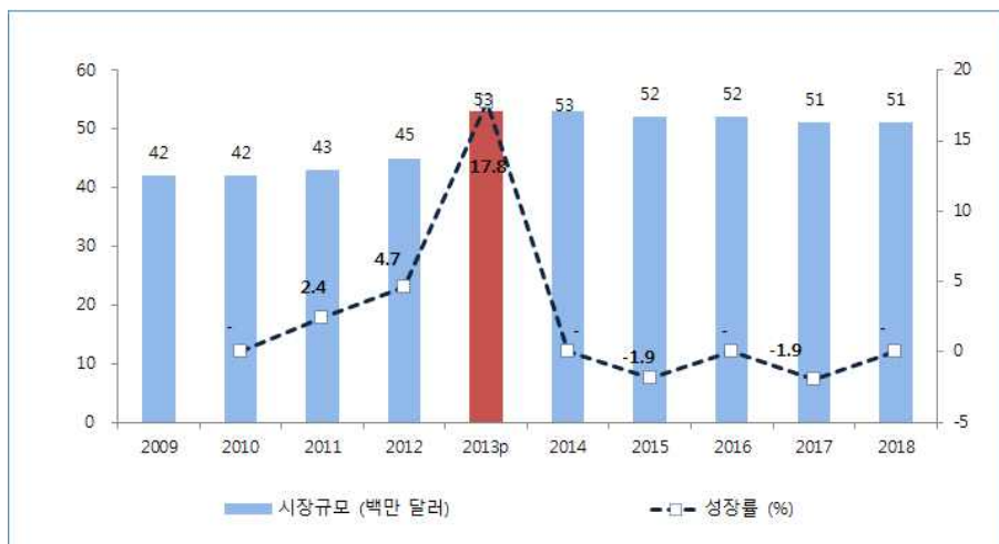
[그림 3-11] 캐나다 인쇄 만화시장 규모 및 성장률, 2009-2018