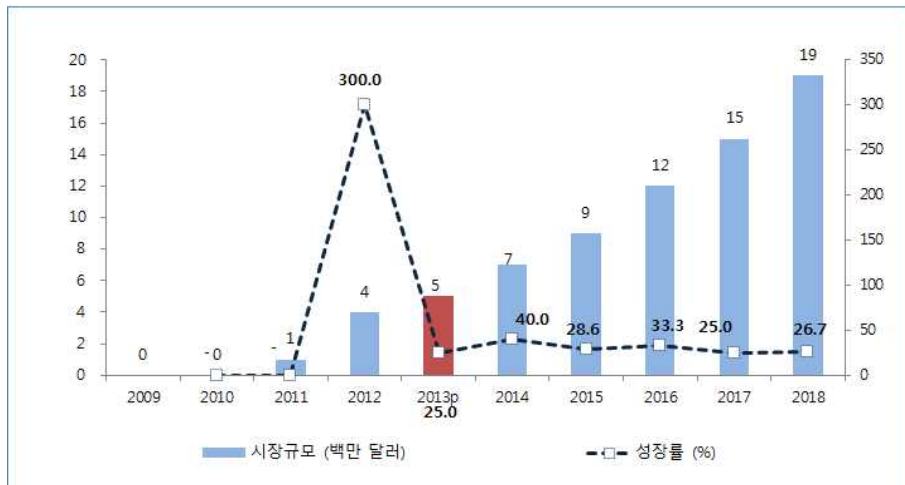
[그림 3-12] 캐나다 디지털 만화시장 규모 및 성장률, 2009-2018