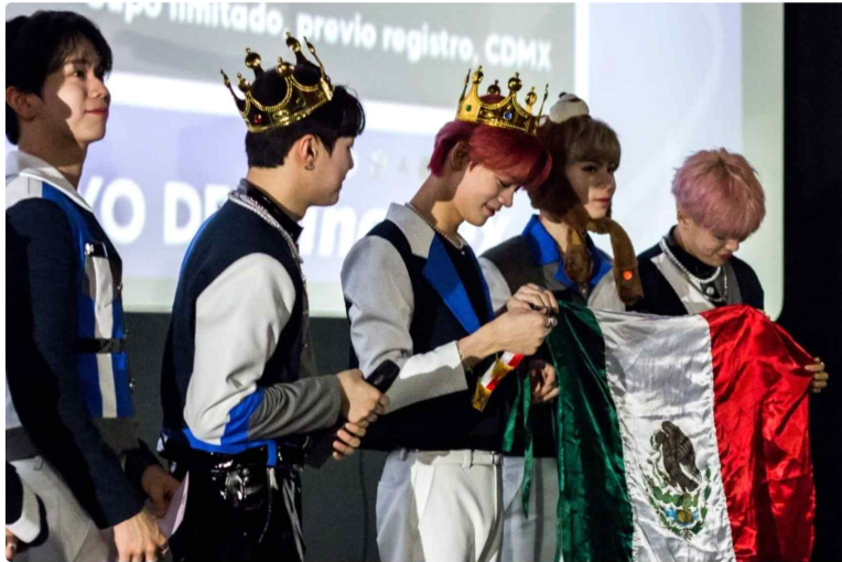
그림 31 멕시코 내 한류확산 요인

멕시코에서는 K-팝 아이돌 팬클럽이 한류 문화 확산에 중요한 역할을 하였다.