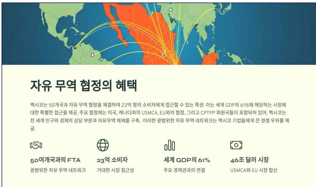
|그림 2| 자유무역협정의 혜택