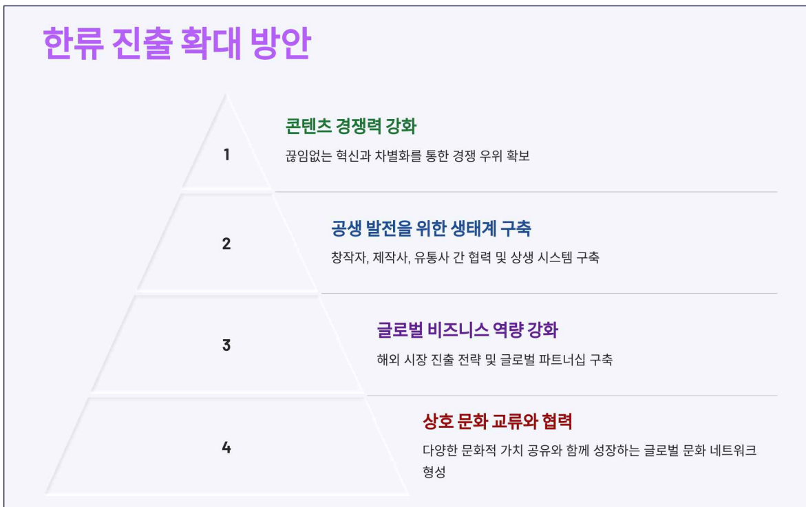
|그림 5| 한류진출 확대 방안