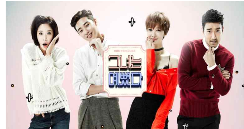
[그림 3] 한류스타 최시원을 내세운 드라마 <그녀는 예뻤다>