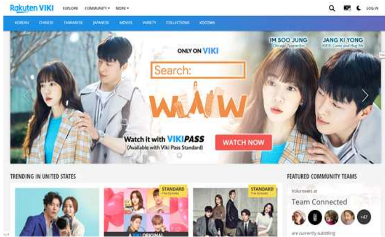
[그림 2] KCP 코코와와 제휴 맺은 OTT 사업자 VIKI 홈페이지