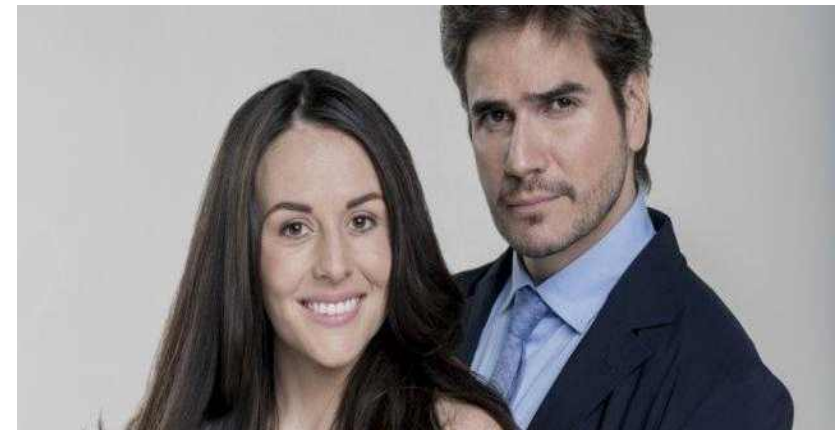
[그림 5] <닝쿨째 굴러온 당신> 리메이크작 <Mi Marido Tiene Mas Familia> 주연배우