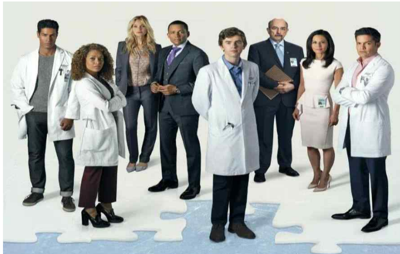
[그림 1] 한국 드라마를 리메이크한 ABC 시리즈