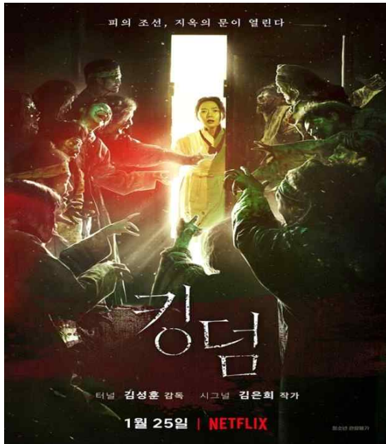
[그림 4] 넷플릭스 오리지널 한국 드라마 <킹덤>