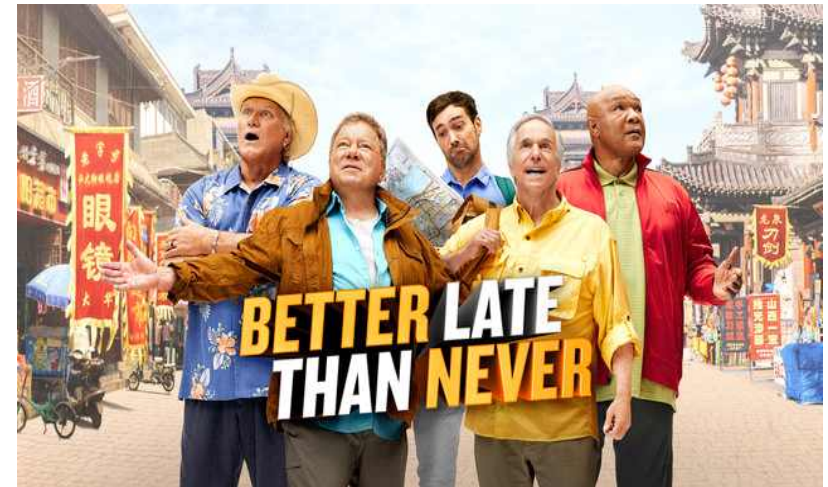
[그림 3] <Better Late Than Never>의 출연진