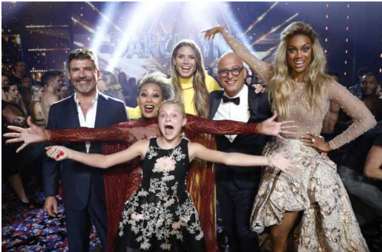
[그림 2] <아메리카 갓 탤런트> 시즌 12의 최종 우승자(가운데)와 심사위원 및 진행자