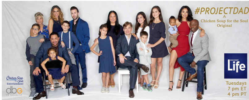
[그림 4] <Project Dad>의 출연진들의 모습