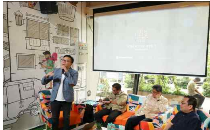
* 이미지 출처 : 구글 이미지