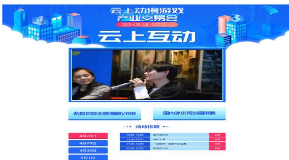
클라우드 교역회 메인 홈페이지 라이브 방송중