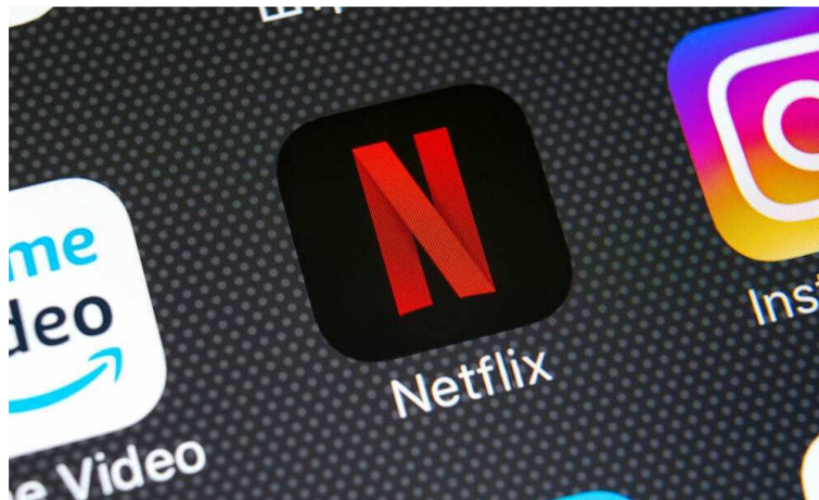
스마트폰 넷플릭스 앱 아이콘