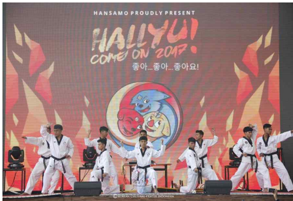
[그림 1] 2017년 반둥 한사모 행사