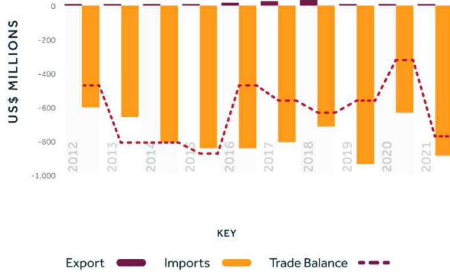
[그림 5] 사우디아라비아 의류 수출 및 수입 그래프 - 패션퓨처 12)