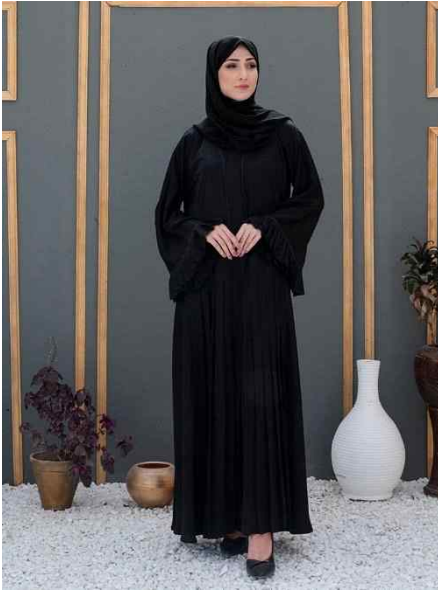
|그림 1| 전통적인 아바야