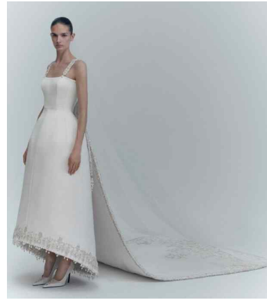
[그림 7] 아시스 스튜디오의 패션쇼