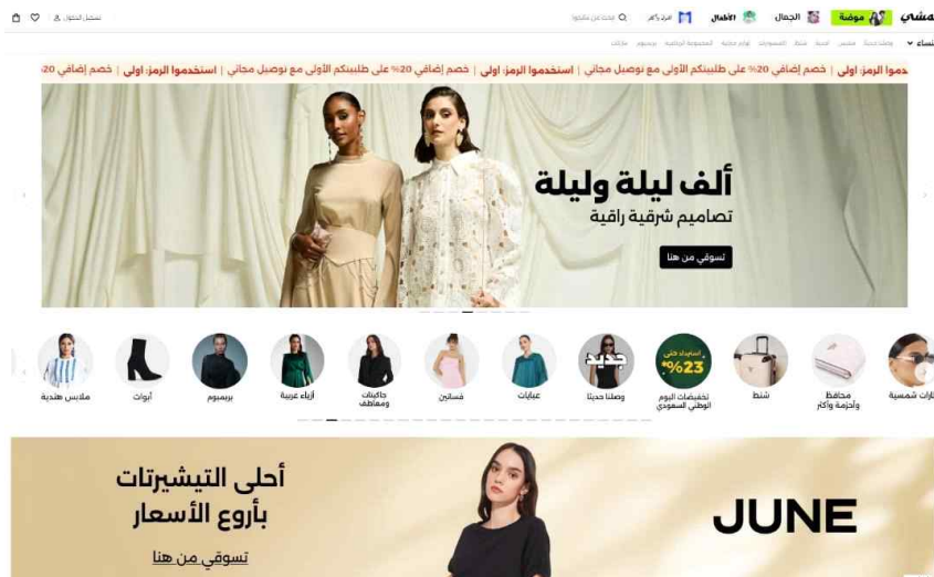
그림 4 | Namshi.com 웹사이트