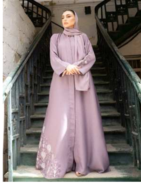
|그림 2| 럭셔리한 최신 아바야