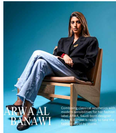
[그림 8] 아시스 스튜디오의 패션