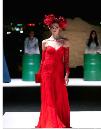
[그림 9] 브랜드 Honayda 패션 스타일