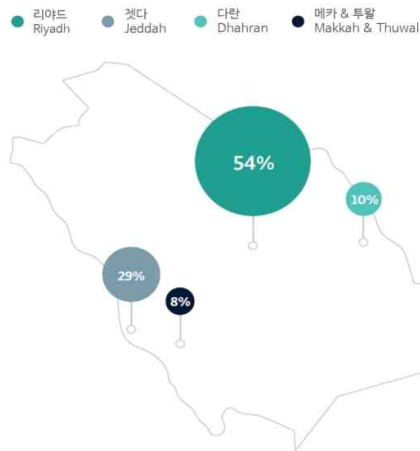
[그림3] 스타트업 지원 단체(기업, 기관 등)의 거점 도시 분포