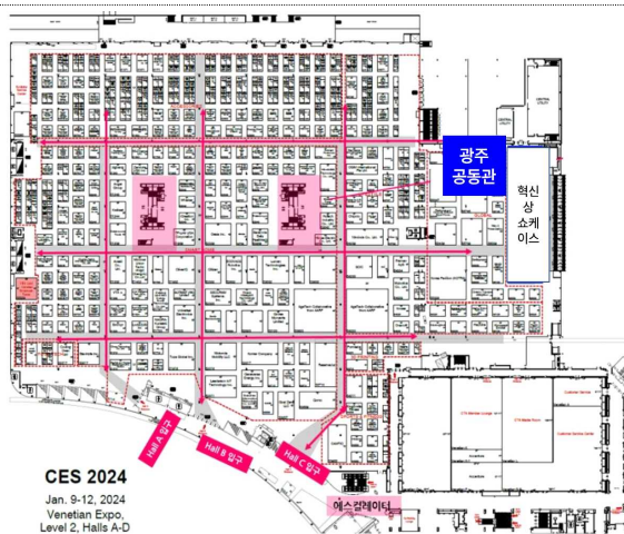
광주공동관(2024) * 베네시안 엑스포 2층, Hall D