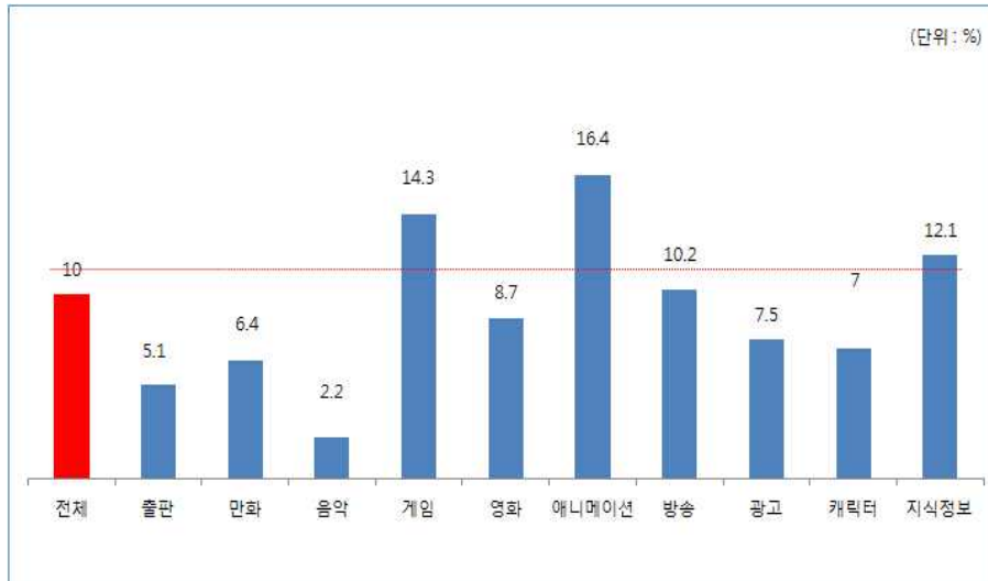
[그림 8-3] 베트남 콘텐츠별 연평균성장률 추정 2013-2018

출처 : PwC(2014), ICv2(2013, 2014), Barnes report(2013, 2014), Box Office Mojo(2014), Digital Vector(2013), EPM(2013, 2014)