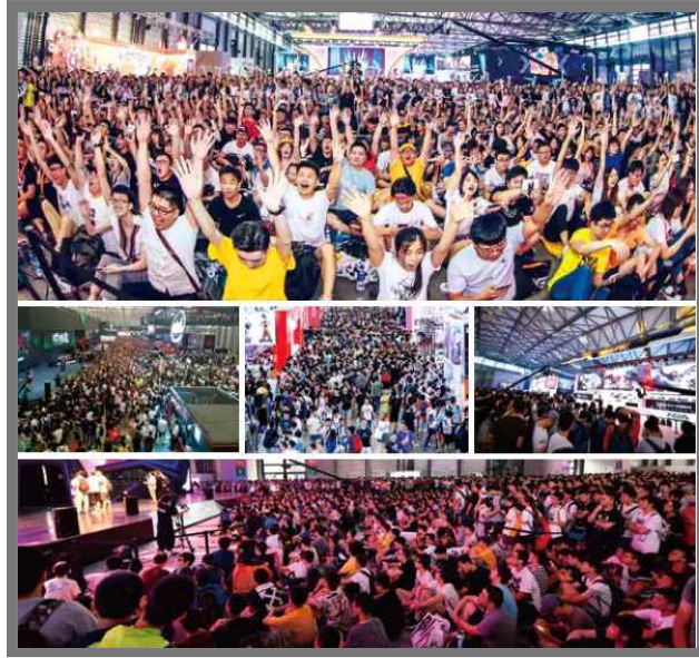
<2018 차이나조이 B2C 현장>