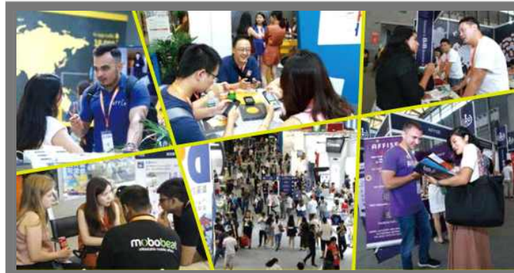
<2018 차이나조이 B2B 현장>