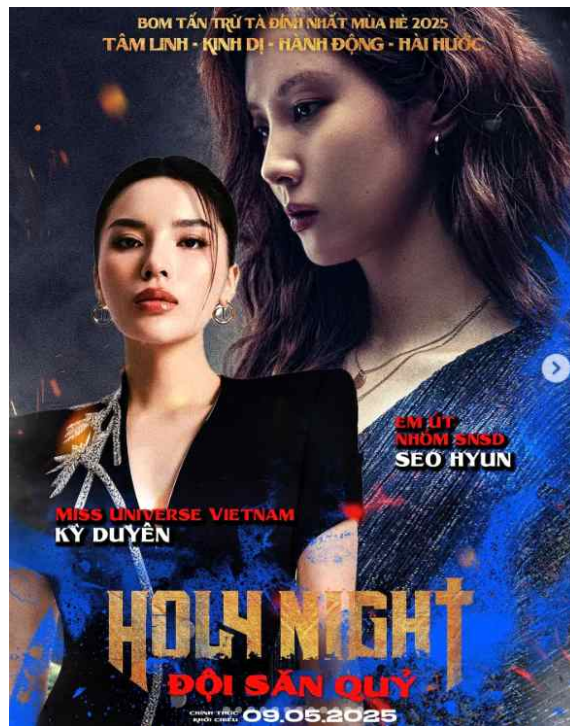
[그림 4] 한국 영화 <거룩한 밤: 데몬 헌터스> 홍보 사진