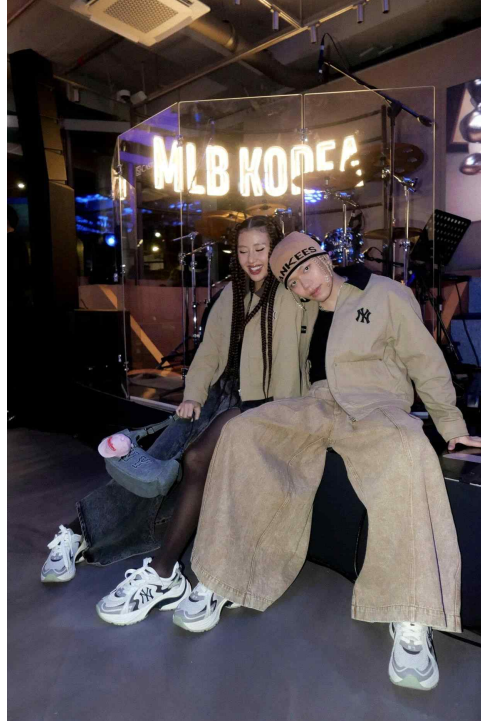
[그림 1] 서울 한남동 MLB 플래그십 스토어 오픈 행사에 꾸인 아인 신이 참여한 사진