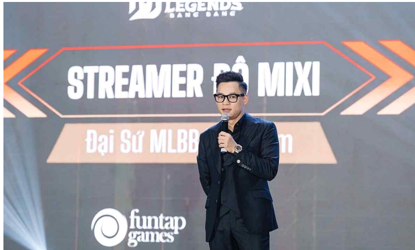
[그림 2] 모바일 레전드: 뱅뱅 게임의 홍보 앰버서더 발표에 도믹시가 참여한 사진