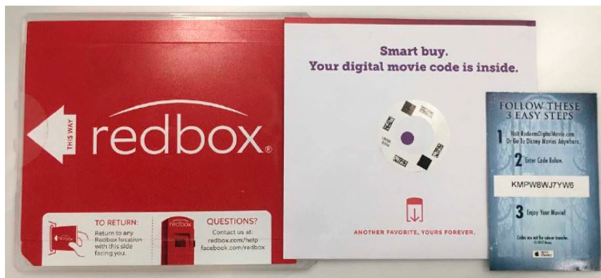
Figure 5 : Redox Re-packaging of Digital Movie Codes