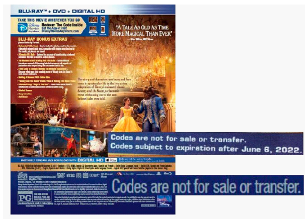
Figure 1 : Outside (Back) Package of Combo Pack